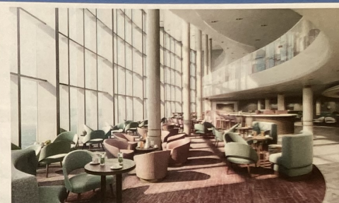
In großzügiger Lounge-Atmosphäre lädt die IONA Coffee Bar an fantastischem Meerespanorama zum gemütlichen Tässchen ein.