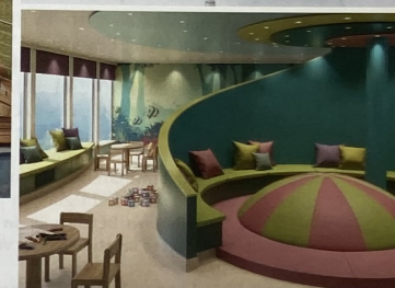
Das Grand Atrium (l.) und der SkyDome (o.) bieten dem feriangerechten Zeitvertrieb eine beeindruckende Bühne. Die Balkonkabine (l. o.), die Gin-Brennerei mit einem 450-Liter-Kessel (l. u.). Das Snowflake-Gelato, gefeiert als beste Melange aus Great Britain und Italien (r. o.), der fröhlich gestaltete Kinderbereich (r. u.).

D er nächste Sommer kann kommen, denn dann heißt es wieder „Ein Schiff wird kommen“. Der neue Zuwachs bei P&O Cruises, einem Carnival-Unternehmen, das vornehmlich im englischsprachigen europäischen Markt aktiv ist, heißt IONA und wurde in der deutschen Meyer Werft in Papenburg gebaut.