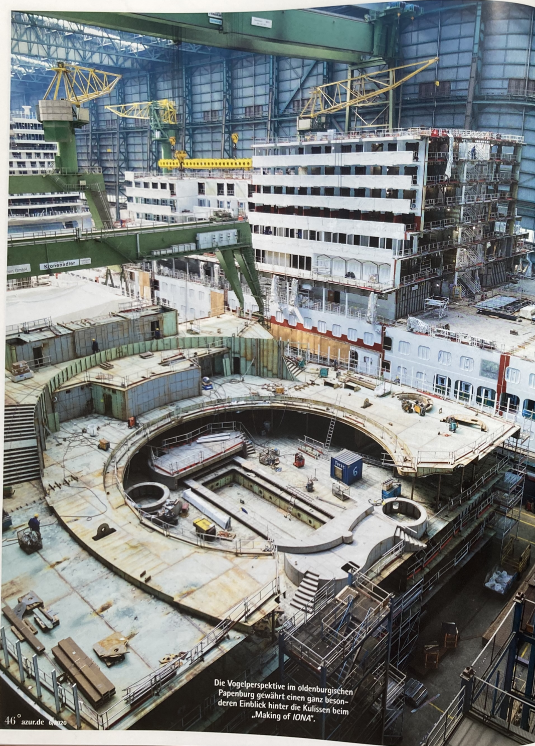
Die Vogelperspektive im oldenburgischen Papenburg gewährt einen ganz besonderen Einblick hinter die Kulissen beim „Making of IONA“.